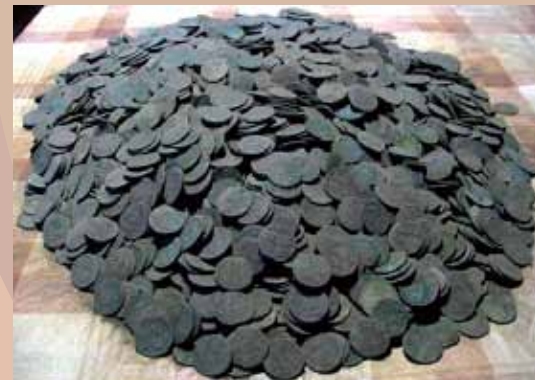
Kuva aarrelöydöstä Eestistä. Kaikki kolikot ovat Kaarle XI:n 1/6 -osa äyrejä.

Oulun Numismaatikot saavat usein arviointipyyntöjä tästä rahatyypistä, sillä niitä löytyy paljon maaperästä. Rahan lyöntimäärä oli yli 100 miljoonaa ja arvo oli aikoinaan todellisuudessa vain kuparin arvo.