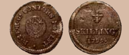
Teksti: Esa Moilanen