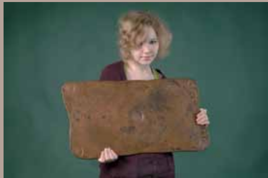
Tytön sylissä on 10 Daalarin plootu vuodelta 1644. Painoa on noin 20 kg.

Rahalöytö lunastettiin Kansallismuseoon. Ne olivat 1970-luvulla näytteillä Pohjois-Pohjanmaan museossa.