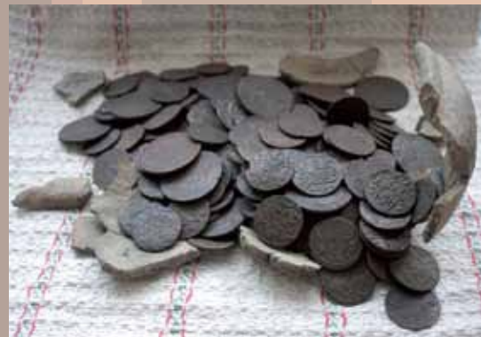
Kuvassa on samat rahat puhdistettuina.

Kolikkojen nimellisarvot olivat 1/4, 1/2 ja 1 öreä, ja ne olivat Kustaa II Adolfin ja Kristiinan ajalta.