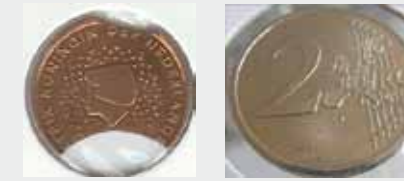
Vajaa aihio ja 2 euroa yhdestä metallista.

jonkin verran kiertoon. Niistä tavallisimmat ovat aihio- tai meistikaisia eli rahan lyöntiin käytetty raha-aihio tai lyöntimeisti on vioittunut.