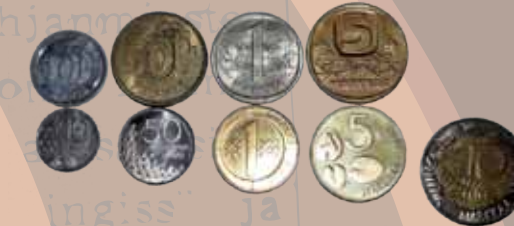
Kuvassa on 1990-luvun alkuvuosina käytössä olleet kolikot.

Vuonna 1992 alkanut ankara taloudellinen taantuma hiljensi keräilymarkkinat. Kaikenlaisia keräilyrahoja sai hankittua huomattavasti edullisemmin kuin 1970-luvulla tai 2000-luvun alussa. Myös kullin hinta romahti ja se menetti suosionsa sijoituskohteena. Oulun Numismaattisen kerhon jäsenmäärä laski vuoden 1995 tienoilla jo noin 50 jäseneen.