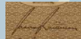
6 Raittinen Paavo