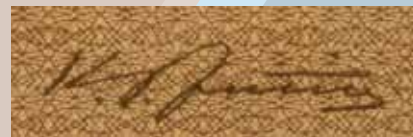
5 Jutila Kalle