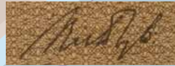
2 Ryti Risto