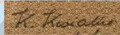
4 Kivialho Kasper