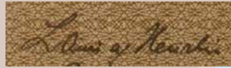
1 af Heurlin Lauri